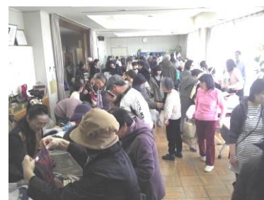
(フリーマーケット風景)

お客様からのご要望もあつたり、次も楽しみにしていますと声がかかり、楽しい一日でした。