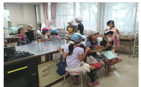
（綿菓子の試食風景）