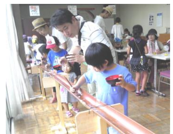
昨年の流しソーメン風景

流しソーメンは楽しくて美味しい！（大人50円・子ども無料） ソーメン以外にも何か流れてくるよ！お楽しみに。 スーパーボールすくい・シャボン玉もできるよ。