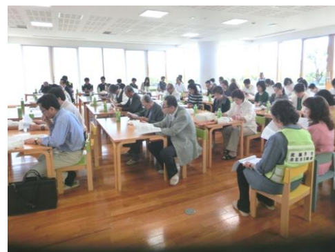
（大野田地域防災の会総会風景）