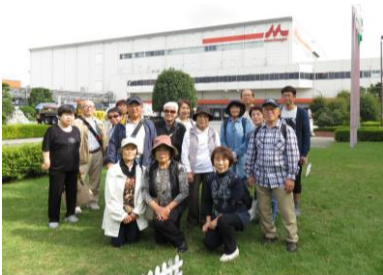
(森永乳業見学集合写真)

秋晴れのさわやかな日差しの中、森永乳業の工場見学に行きました。記念写真を撮っていただき工場の中へ。まずはヨーグルトの試食。4～5人でグループを作りチーズ作りを体験、その後試食をしました。なんとまるやかなチーズでした。工場ではリサイクルにも力を入れていて、牛乳パック6枚でトイレトペーパーが1個できるということも知りました。