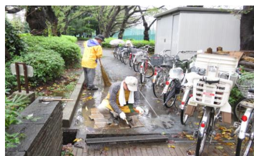
水たまり補修作業中